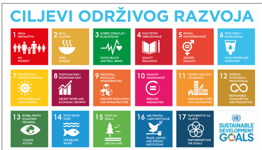
Slika 1. Ciljevi održivog razvoja

Neosporiv značaj agende predstavlja to da je ona rezultat dvogodišnjih intenzivnih javnih konsultacija i angažmana s civilnim društvom i drugim sudionicima diljem svijeta, koji su obratili posebnu pozornost na glasove najsiromašnijih i najugroženijih. 17 ciljeva održivog razvoja prikazan je kroz sliku 1 6 . Ciljeve koje ćemo u nastavku elaborirati su sljedeći: a) Mir, pravda i jake institucije ; b) Nema siromaštva ; c) Kvalitetno obrazovanje ; te d) Rodna ravnopravnost . Navedeni ciljevi su upravo oni koji posebno ističu nexus održivog razvoja, mira i sigurnosti, a posebno pozitivnog mira, kojem ćemo se vratiti pri kraju rada. Unutar navedenih ciljeva također postoje određeni podciljevi, koje ćemo taksativno nabrojati, a nakon toga obrazložiti zašto oni upravo ukazuju na nexus održivog razvoja i pozitivnog mira.